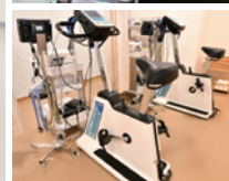
運動負荷心電図検査